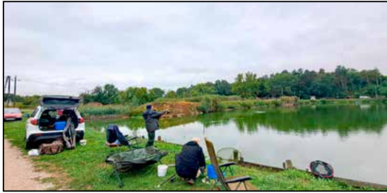
Esős időben is haraptak a halak

A versenyen részt vett polgárőr egyesületek: Bogyiszlói P.E. Tolna Vármegye, Kiskunlacháza P.E. Pest Vármegye, Kunadacs P.E. Bács-Kiskun Vármegye, Magyarszék P és ÖTE. Baranya Vármegye, Pogány P és ÖTE. Baranya Vármegye, Taktaharkány P.E. I. csapat Borsod-Abaúj-Zemplén Vármegye, Tak-