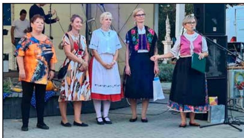
Bemutakoztak az új képviselők

csokrot adott elő, majd a Gyönki GrüneWiese Német Nemzetiségi Ifjúsági táncsoportja következett, később egy helyi kórus következett, akiket már régóta ismerhetünk és hallhatunk: a Gruss und Kuss kórus Tamásiból. Műsorunkat a már jól ismert Németkéri Német Nemzetiségi Táncsoport zárta, most is mint mindig nagy sikerrel!