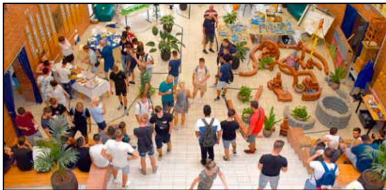
Minden ágazat bemutatkozott a hét során

Az első nap az iskola megismeréséről szólt. A tanulók a tanévnyitásokat és osztályfőnöki órákat követően logót terveztek és mottót találtak ki, mini filmeket készítettek iskolájukról, valamint csapatépítő játékokat játszottak. Kedden főként a modern oktatási módszerek megismerésére és alkalmazására helyezték a hangsúlyt. A diákok interaktív tanórák keretében gyakorolhatták a digitális eszközök – okostáblák, tabletek és edukációs applikációk – használatát, de foglalkoztak robotikával és digitális történetmeséléssel is. Kiemelt fontossága miatt a fenntarthatóság, környezettudatosság témájának is szenteltek egy napot az intézmé-