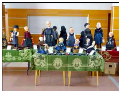
Nagy sikert aratott a német népviseleti baba kiállítás

A 8. Tungi Fesztivál szeptember 21-én délután 15 órakor kezdődött kulturális bemutatóval, az első fellépőnk a Würtz Ádám Általános Iskola német nemzetiségi táncsoportja volt, majd őket követte az óvoda Szivárvány (Regenbogen) német nemzetiségi csoportja. A kicsik vidám táncai után