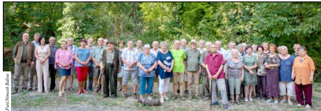
Ismét találkozhattak a nyugdíjas kollégák

Délután órák múlva vettek búcsút egymástól a résztvevők, a jövő évi találkozó ígéretével és a részvételi szándékuk megerősítésével.