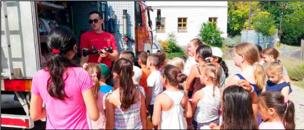
A tűzoltó szakmával is megismerkedhettek a gyerekek

A Tamási Szociális Központ alapítványa, a Közel a Segítség Alapítvány április 26-án este jótékonyági retro disco-t szervezett Tamásiban, a Deja Vu Rendezvénycsarnokban.