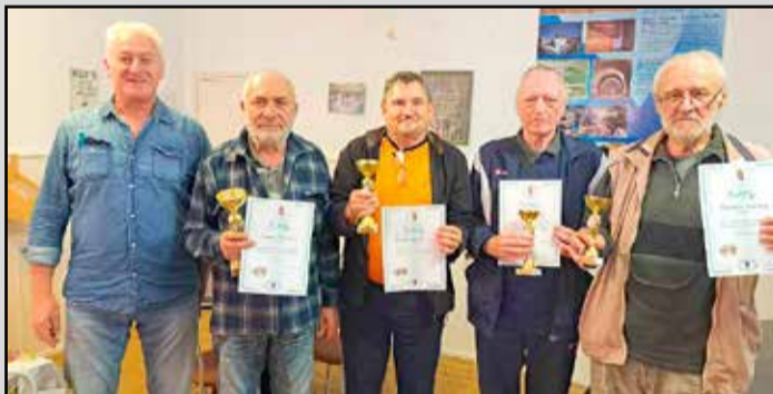
Az udvari forduló legjobbjai

rült sor. A találkozó nagyon jó hangulatban telt, szórakoztatást és kikapcsolódást egyaránt jelentett a harminc résztvevőnek. A játék mellé finom ebéd is járt: szarvaspörkölt tarhonyával és főtt burgonyával, valamint