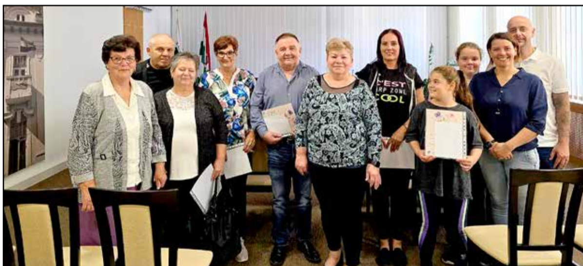
Átadták a díjakat az első hat helyezettnek

Tamási Város Önkormányzata az idei évben immár ötödik alkalommal hirdette meg a „Tiszta Porta Virágos Kert” elnevezésű programot, melynek célja volt elismerni, értékelni mindazon lakókat, akik aktívan tesznek környezetük szépségéért, rendeztségéért, ezáltal is hozzájárulva Tamási arculatának szépítéséhez, a városi környezet szebbé tételéhez, így a lakosság életminőségének javításához, a zöldfelületek példamutató kialakításával, tiszta, rendezett, virágos városkép létrehozásához.