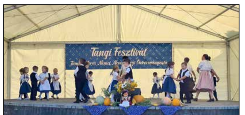
Az óvodások nagyon készültek a fellépésre