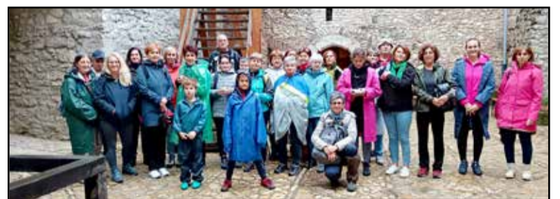
A kicsit hűvösebb idő sem szegte kedvét a kirándulóknak

Megérkezésükkor még esett az eső, de mire végignézték Nagyvázszy legfőbb nevezetességét, a lakótoronyról híres szépen felújított várat, elállt az eső és útra kelhettek az Országos Kéktúra vonalán. Mindjárt az út elején a Szent Mihály-domb erdejének sűrű csendjében újabb ősi romokat pillantottak meg: a Szent Mihály-kolostor hatalmas templomának gótikus pillérekkel és oszlopokkal megtámasztott légies falait. Tovább haladtak az erdei úton a Vázsonyi-séd felé. A gyaloglást ugyan nehezítette az esőtől felázott talaj, de ez egyben kedvezett is a gombák növekedésének, így özlábgombák is kerültek a hátizsákokba. Az útvonalon haladva újabb középkori maradványokra bukkantak az erdőben: a Szent Ilona-templom romjaira. Az egy részen fenyvesszel szegélyezett, csodálatos Tálódi-réten tovább