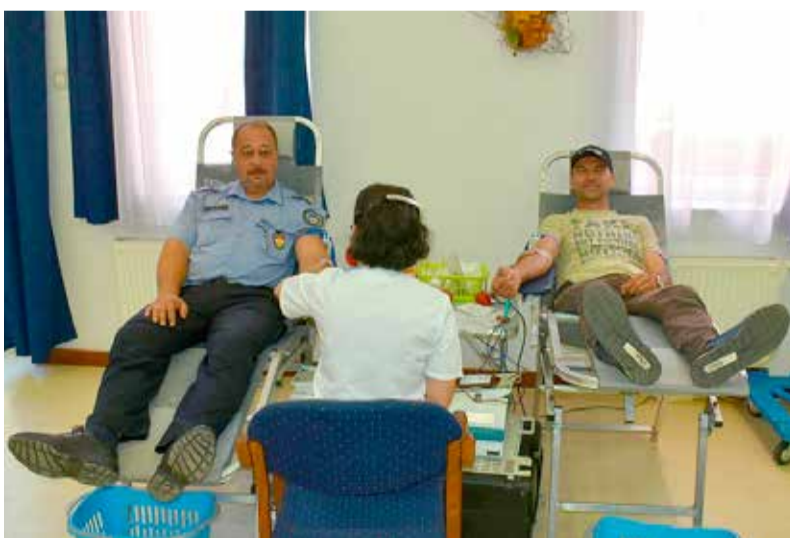
Ismét sokan nyújtották a karjukat önzetlenül

A Tamási Rendőrkapitányság munkatársai ismét hozzájárultak a rászorulóknak életének megmentéséhez.