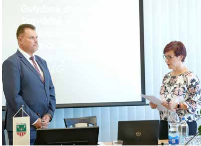
Porga Ferenc polgármester letette a polgármester esküt

kialakítása, programok szervezésében való közreműködés, valamint a rendezvényeken, eseményeken való részvétel, azokon a polgármester helyettesítése. Az alpolgármesterek eskütétele után lezajlott a polgármester, valamint az alpolgármesterek illetményének megállapítása és meg-