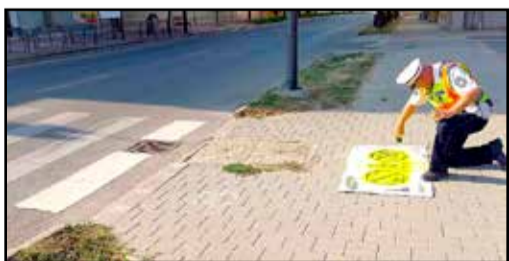
Tamásiban is láthatók már a piktogramok

Az Országos Rendőr-főkapitányság Országos Balesetmegelőzési Bizottsága a gyalogosok és kerékpárosok évének minősítette 2024-et. Ennek jegyében folyamatos kampányokkal hívják fel a közlekedők figyelmét a közlekedés két legvédtelenebb résztvevőjére. A világ számos pontján, így Magyarországon is sok-sok gyalogos-átkelőhely előtt festettek fel figyelemfelhívó piktogramokat annak érdekében, hogy a gyalogosok figyelmesen keljenek át az úttesten. Hogy miért van ezeken szükség? A képernyő folyamatos