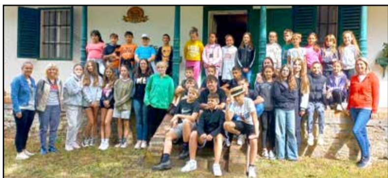
Tartalmas kiránduláson vehettek részt a diákok

Utunk első állomása Nagymányokon a Német Nemzetiségi Tájház volt, ahol a helyi németek tárgyi emlékeit tekinthettük meg közelebbről. Az 1880-ban épült, négy helyiségből álló (tiszta szoba, konyha, lakószoba, kamra) kis lakóházat végigjárva betekintést nyerhettünk a svábok életkörülményeibe, mindennapjaiba, miközben a tájház gondnoka a gyermekek számára tárlatvezetést is nyújtott. Ezután tanulóink kvízkérdések megválaszolásával ellenőrizhették a megszerzett tudást. Színes feladatlapon, csoportmunkában lelkesen mérték össze tudásukat. Ezt követően utunk Bonyhádra vezetett. A város főterén egy győ-