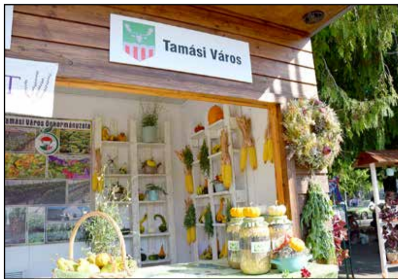
Tamási város standja