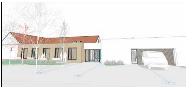
A beruházás előzetes látványterve

Plusz céljához és az abból levezetett felhívás céljához, illetve az ön-