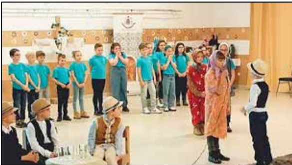
Nagy sikert aratott a diákok műsora

„Arról tudják majd meg rólatok, hogy a tanítványaim vagytok, hogy szeretettel vagytok egymás iránt.” Jn 13,35