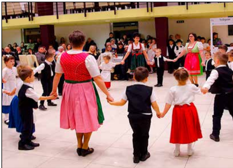
Az Aranyerdő Óvoda Szivárvány csoportjának műsora

Az est kezdetekor, mint mindig, most is egy kulturális bemutatóra került sor, ahol fellépett a Tamási Aranyerdő Óvoda Szivárvány német nemzetiségi csoportja és a Würtz iskola német nemzetiségi táncscsoportja. Két nemzetiségi kórus is elfogadta a meghívásunkat: a Pári német