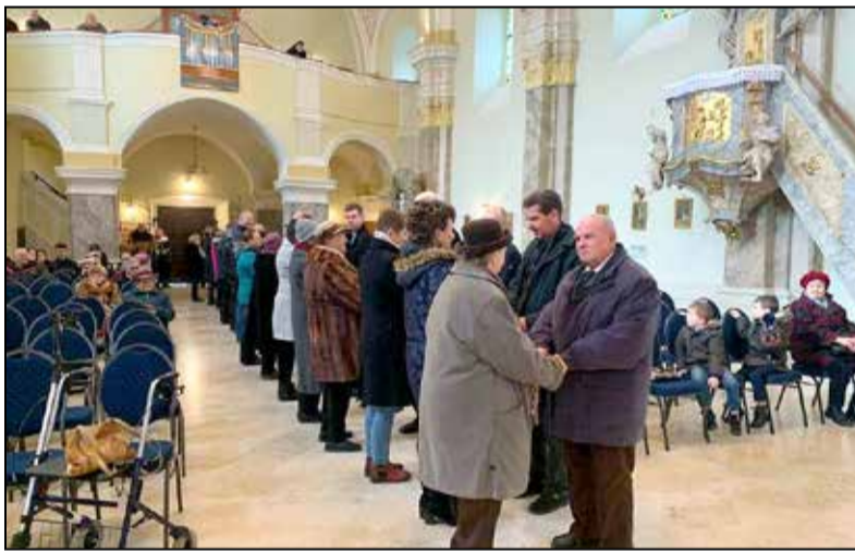
Idén is megáldották a házaspárokat a templomban