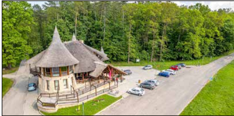
Az eddigi egyik legmagasabb pontszámot szerezte a hazai minősített szolgáltatások között a DámPont

Tamásiban található Magyarország első Good Travel Seal nemzetközi fenntartható turisztikai minősítést szerzett ökoturisztikai bemutatóhelye, amely egyben Tourinform irodaként is működik. A DámPont Látogatóközpont az eddigi egyik legmagasabb pontszámot szerezte a hazai minősített szolgáltatások között, így elérte a platinum szintet. Az ötszintű rendszerben a platinum, illetve gyémánt szint megszerzéséhez a Global Sustainable Tourism Council (GSTC) által meghatározott nemzetközi standardoknak min. a 75%-át teljesíteni szükséges, ami nagyon komoly teljesítményt jelent a vállalkozások részéről. Ezért is kiemelkedő, hogy a tamási DámPont Ökoturisztikai Látogatóközpont is elérte a platinum fokozatot. Ezzel 17-re nőtt az összes minősített szolgáltatás száma Magyarországon. A DámPont Látogatóközpont 2020 óta fogadja a látogatókat. Az épületet úgy alakították ki, hogy az mozgáskorlátozottak, látás- és