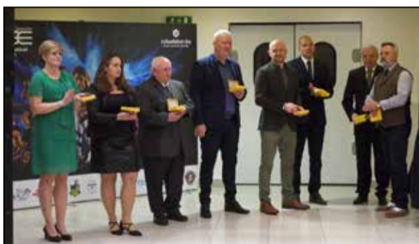
Az est kitüntetettjeinek egy része

Az idei évben tizedik alkalommal rendezte meg a Tamási Szabadidő és Sport Egyesület a helyi sportegyesületek közreműködésével a város egyik legnagyobb létszámú bálját, a Sportbált.