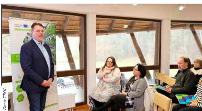
A város polgármestere is köszöntötte a konferencia résztvevőit