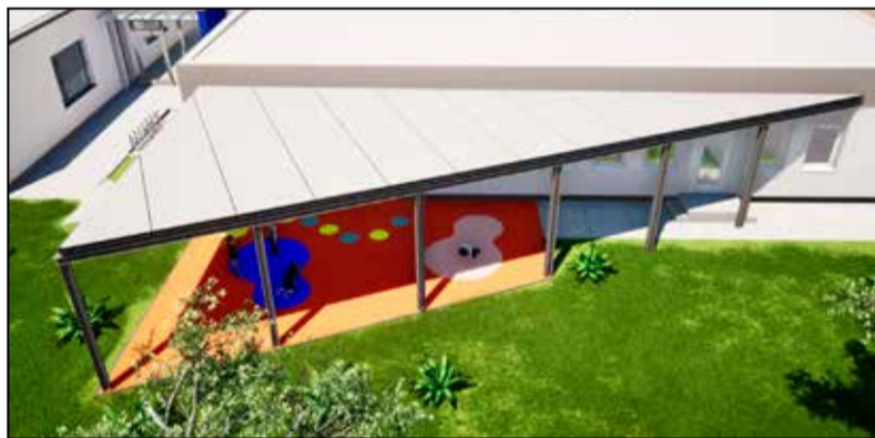
Új terasz is készül majd a beruházás során

Tamási Város Önkormányzata a TOP Plusz-3.3.1-21 azonosítószámú, „Gyermeknevelést támogató humán infrastruktúra fejlesztése” c. felhívásra támogatási kérelmet nyújtott be 2024 elején. A projekt 2024. 10. 31-én támogatói döntésben részesült. Ennek keretében Tamási Város Önkormányzata a tulajdonában lévő Tamási, Béri Balogh Ádám u. 1-3. szám, 694/10 hrsz. alatti ingatlanon lévő Tamási Aranyerdő Óvoda és Bölcsőde egyik épületének felújítását tervezi, ahol a meglévő csoportszobák (óvodai és bölcsődei), kapcsolódó helyiségek, közös helyiségek elektromos, gépészeti, építészeti szempontú felújítása tervezett férőhely bővítés nélkül. A jelenlegi épületben, mely az 1970-es évek végén títusterv alapján épült, 7 óvodai csoport, valamint 3 bölcsődei csoport működik. A bölcsődei csoportszoba helyiségek nem tervezetten, kényszerű helyiség elhelyezéssel kerültek korábban kialakításra. Ennek