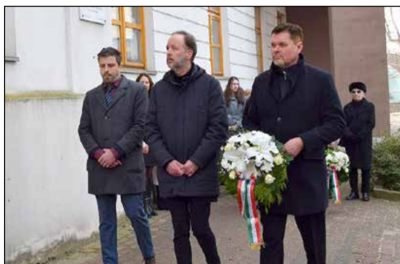
Koszorút helyeztek el az önkormányzat nevében is

Az Országgyűlés 2000-ben elfogadott rendelete értelmében minden év február 25-én tartják a kommunizmus áldozatainak emléknapját. Tamásiban idén is a Würtz iskola falán található, 1926-ban felállított, majd 2002-ben újra felavatott emléktáblánál tisztelegtek az áldozatok előtt.